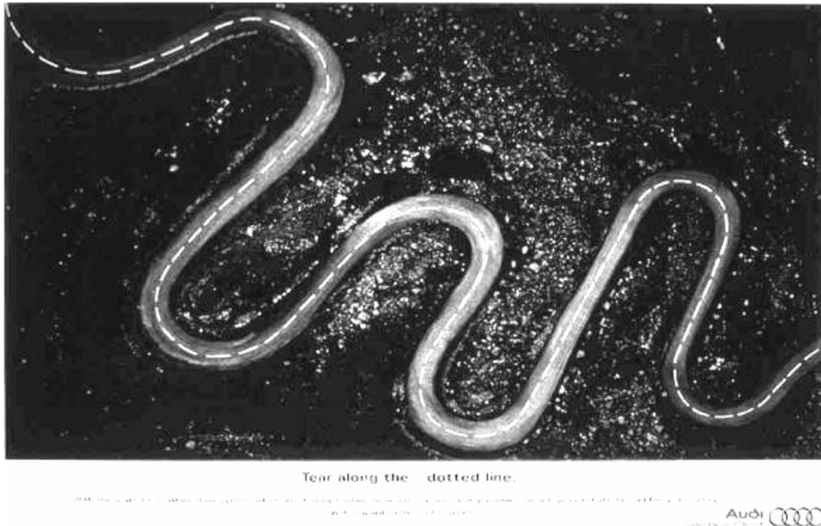
Abb. 5: Bartle Bogle Hegarty (1998), Tear Along (Audi Quattro-Werbung)

Bei der inhaltlichen Bildmetapher handelt es sich dagegen um die Verbildlichung einer Sprachmetapher. Das Phrasem über den eigenen Schatten springen kann auch als ikonisches Bild dargestellt werden. 7