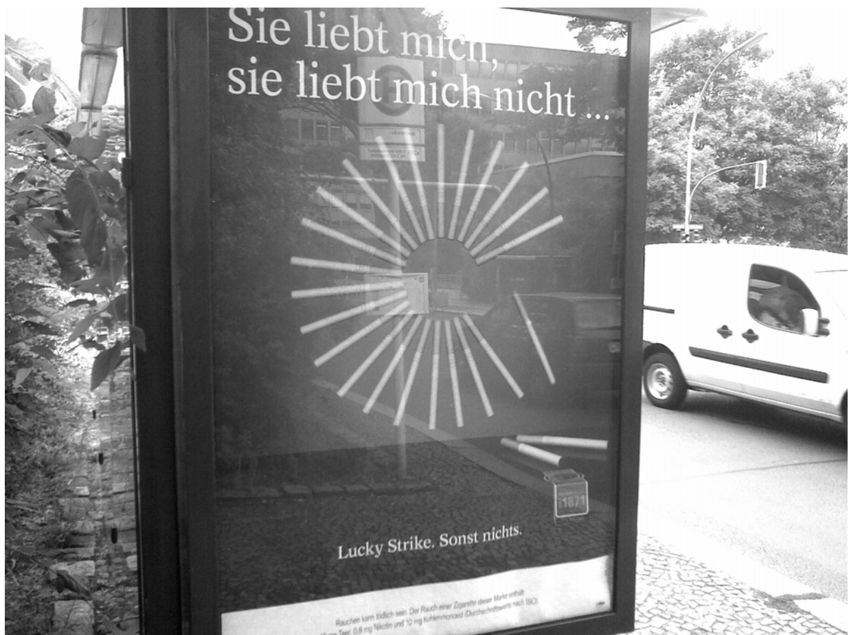
Abb. 2:

Eine Untersuchung der zeichentheoretischen Relevanz von Farbe(n) muss nicht zwangsläufig durch explizite Bildsemiotik erfolgen. Ansätze der Allgemeinen Semiotik können schon sehr brauchbar sein.