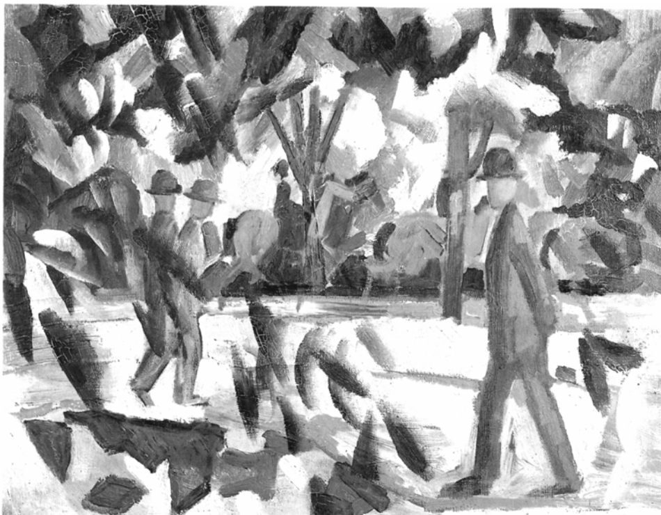
Abb. 6: August Macke (1914), Reiter und Spaziergänger in der Allee